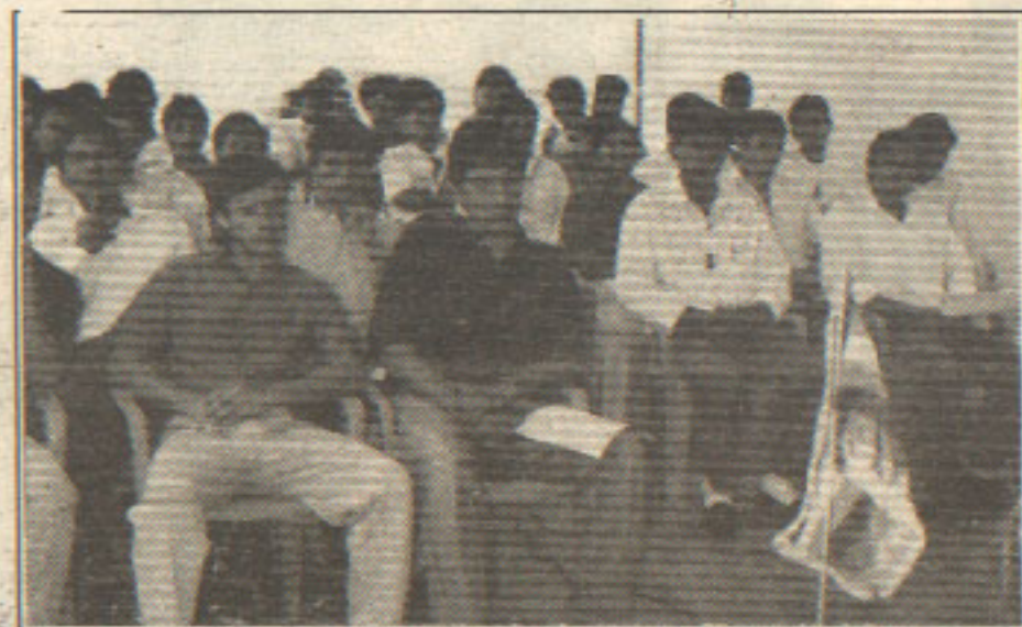
La cultura empresarial debe iniciarse con el cambio de mentalidad de los dirigentes cooperativistas y llegar a todos los socios.

-Al margen de ello, ¿se están efectuando otros esfuerzos por lograr un nuevo cooperativismo en el